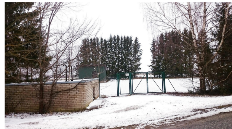
Foto 5. Vaade Vastemõisa teelt puurkaevu suunas