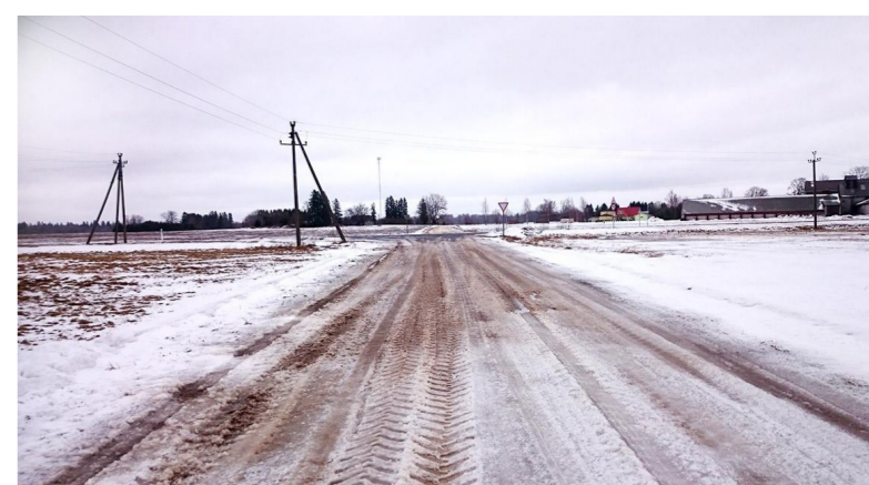
Foto 1. Vaade ristmikule planeeringuala põhjaosas vaatega itta