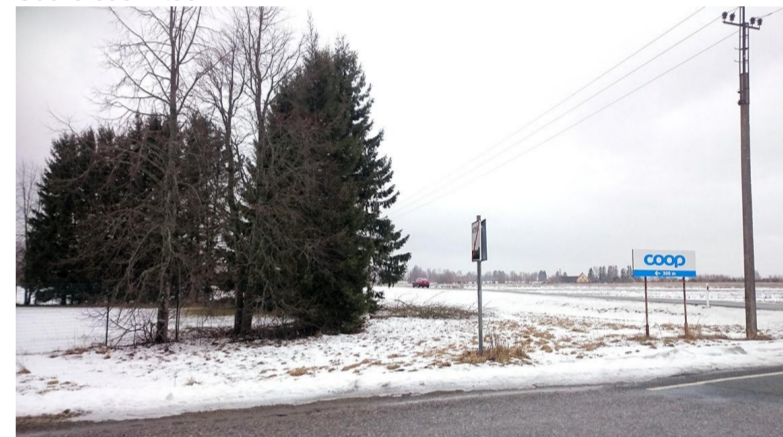
Foto 4. Vaade Vastemõisa teelt planeeringu ala suunas