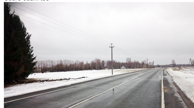
Foto 3. Vaade planeeritava ala kagust, esiplaanil Viljandi - Suure-Jaani tee