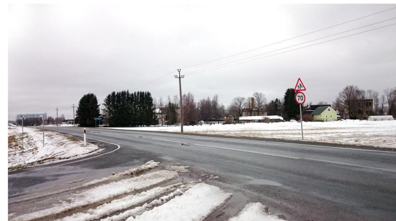
Foto 2. Vaade planeeritava ala kirdest, esiplaanil Viljandi - Suure-Jaani tee